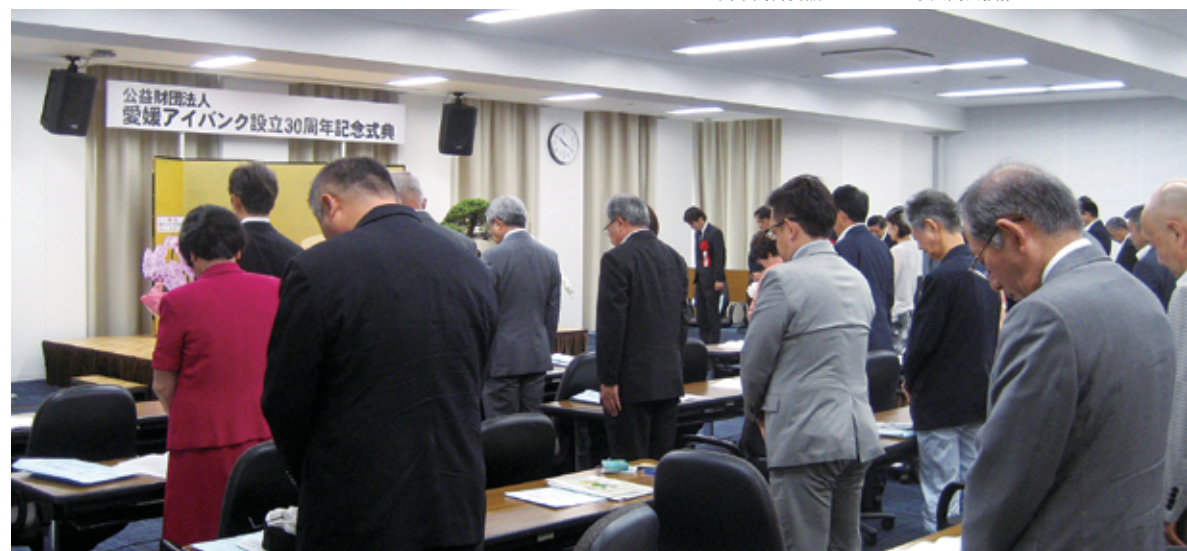
▲ご献眼頂いた方々へ黙祷